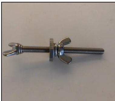
4) カットガイド取付シャフト・ネジ一式 部品番号: 2515 2本1組 8,000