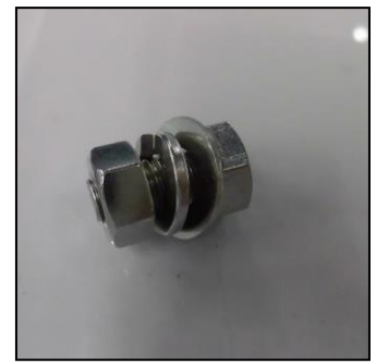
6) 包丁用ツバ取付用ネジセット 部品番号: 3924 ¥600