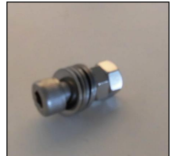
3) 支点用ネジ一式 部品番号: 3926 ¥900