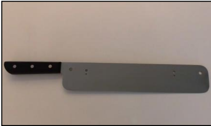
1) 包丁 (刃渡り36cm・刃厚1.8mm) 部品番号: 3511 ¥27,000