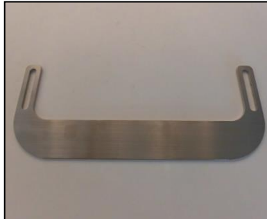
2) カットガイド 部品番号: 3925 ¥8,000