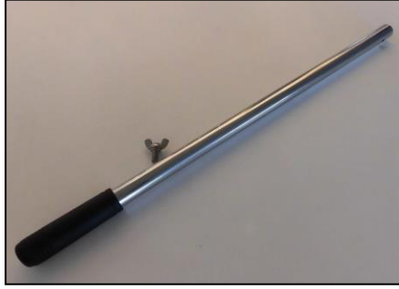
1) ハンドル 部品番号: 3853 ¥12,000