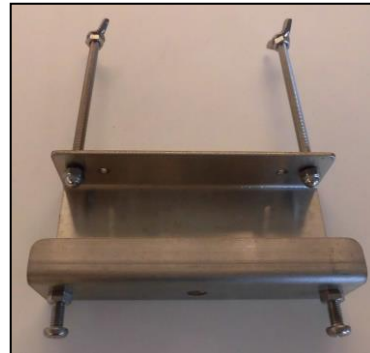
8) ピラー用ホルダー一式(左用) 部品番号: 3858 ¥9,300

刃物部(ワンタッチパイプピラー/PWシリーズ)は別売りです。 刃物部の部品が必要な方は 別途ワンタッチパイプピラーの部品表をご確認ください。