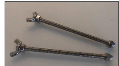
6) ワンタッチ固定ネジセット 部品番号: 3859 2本1組 ¥3,000