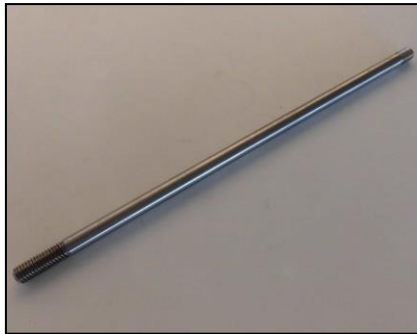
4) 押し出しシャフト 部品番号: 3855 ¥3,100