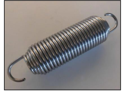
3) バネ 部品番号: 3854 ¥9,400