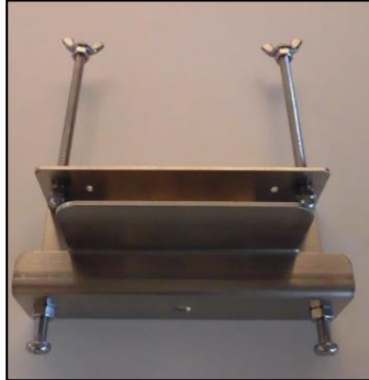
7) ピラー用ホルダー一式(右用) 部品番号: 3857 ¥9,300