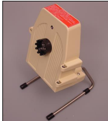
2)スタンド部一式 部品番号:3917 ¥14,000