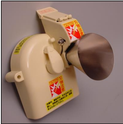
1)カバー部一式 部品番号:2516 ¥26,000