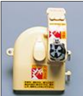
1)カバー部一式 (分割刃付) 部品番号:3539 ¥38,000