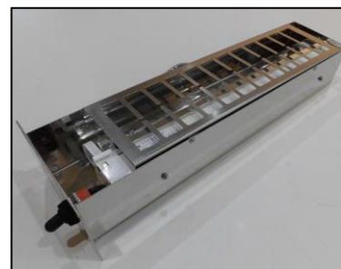
6) グローレス用殺菌灯BOX一式 部品番号: ¥29,000