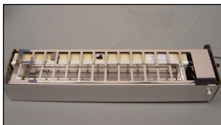
5) 殺菌灯用BOX一式 部品番号: 3891 ¥29,000