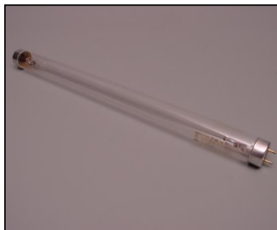
1) 殺菌灯ランプ10W (GL-10) 部品番号: 3101 ¥3,100