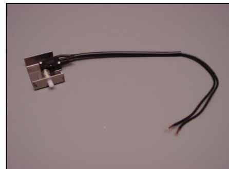
3) ドアスイッチ一式 部品番号: 3918 ¥5,400