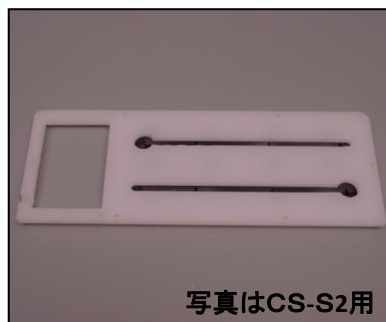
5) フター式 CS-S2用 部品番号: 2502 ¥11,000 CS-S2L用 部品番号: 2503 ¥12,000 CS-S3L用 部品番号: 2504 ¥14,000