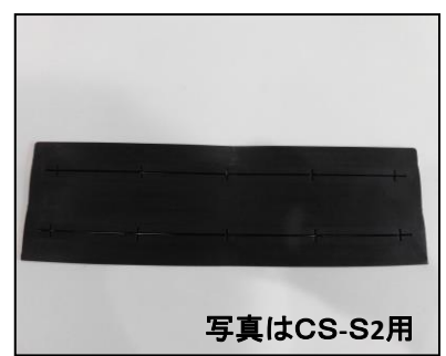
6) 遮光用ゴム CS-S2用 部品番号: 3943 ¥2,000 CS-S2L用 部品番号: 3944 ¥2,500 CS-S3L用 部品番号: 3945 ¥2,700