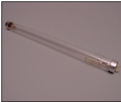
1) 殺菌灯ランプ10W (GL-10) 部品番号: 3101 ¥3,100