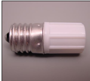
2) グローランプFG-7E 部品番号: 3095 ¥200