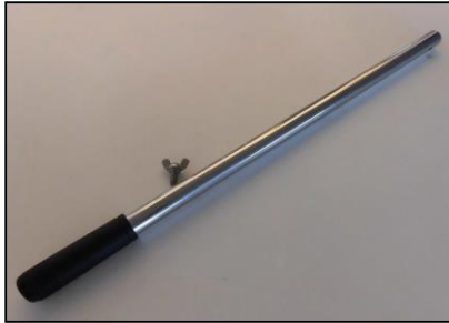
1) ハンドル 部品番号: 3853 ¥10,800