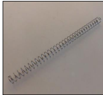
5) 押しシャフト用バネ 部品番号: 3856 ¥2,500