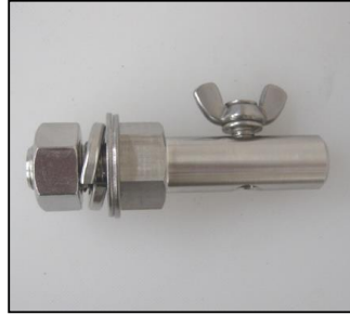
2) ジョイントバー式 部品番号: 3852 ¥7,200