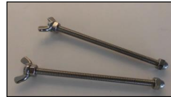
6) ワンタッチ固定ネジセット 部品番号: 3859 2本1組 ¥2,400