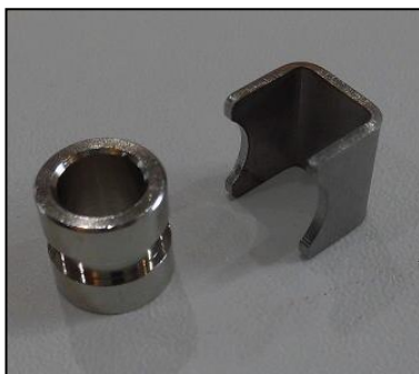
7)ストッパ-付きインサート(2個セット) 部品番号:3942 ¥1,400