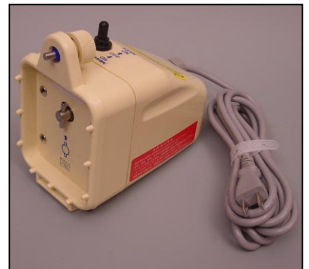
3)モーター部一式 部品番号:3893 ¥30,000