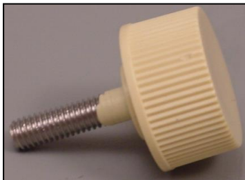
4)モーター止めネジ 部品番号:3884 ¥500