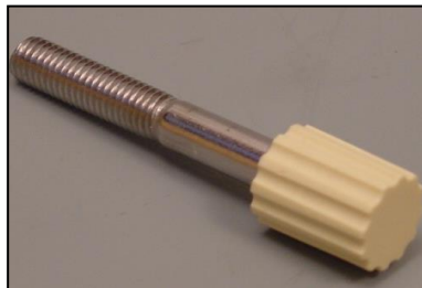
5)カバー止めネジ 部品番号:3920 ¥500