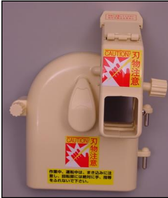
1)カバー部一式 部品番号:3892 ¥12,000