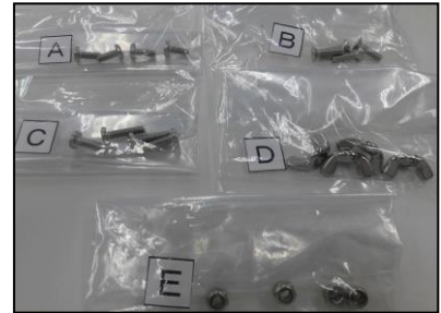
3)ネジ・ナットセット A ~ E 部品番号: 3940 ¥2,200