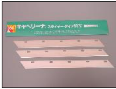
2)替刃(3枚1組) 部品番号: 3084 ¥1,200