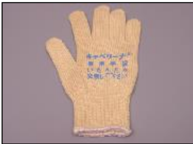
1)安全手袋 部品番号: 3086 ¥1,100