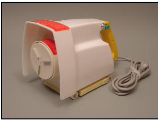
1) モーター部一式 部品番号: 2242 ¥69,600