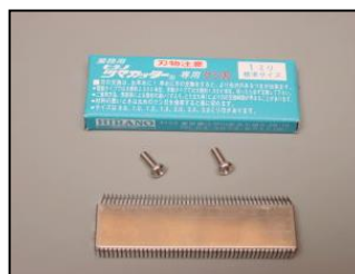
5) クシ刃1.0mm 部品番号: 3032 ¥2,800