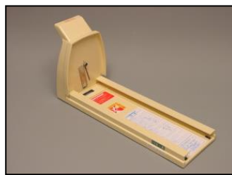
2) ベース一式 部品番号: 2246 ¥20,500