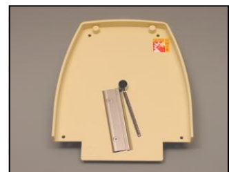
3) 刃物カセット一式 部品番号: 2248 ¥11,700