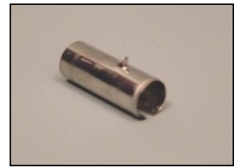
6) 丸刃 部品番号: 2306 ¥600