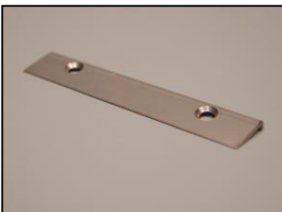
7) 平刃押え 部品番号: 2255 ¥2,400