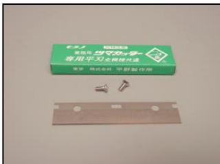
4) 平刃(10枚入り) 部品番号: 3034 ¥1,200