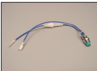
10) スイッチ一式 部品番号: 2250 ¥4,200